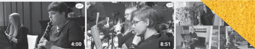
Guardians of Peace - James ... Hosay