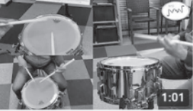
Wie klingt eigentlich eine Snare Drum?